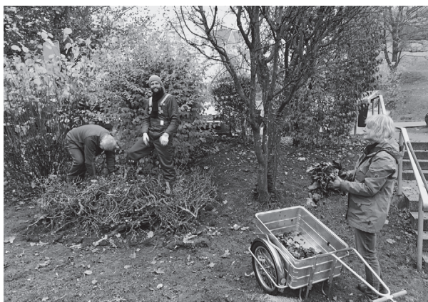
Gruppe «nachHALDig» in Aktion