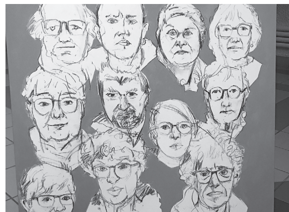
Portraitsbild gemalt von Daniel Schelling