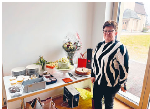
Bild: Abschiedsfest

Seit November 2019 war sie für unsere Kirchgemeinde als Mesmerin im Heiligkreuz tätig. Sie war jederzeit für die Anliegen der Kirchbürgerinnen und Kirchbürger da. Nun zieht sie weiter, um sich einer neuen Herausforderung zu widmen. Für ihren Einsatz danken wir ihr von Herzen und wünschen ihr für die Zukunft alles Gute.