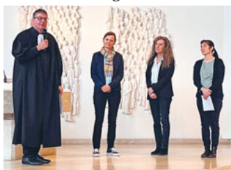
Bild: Abschiedsgottesdienst

Sie war jederzeit für die Anliegen der Kirchbürgerinnen und Kirchbürger da. Sie hat sich entschieden, die Pension anzutreten.